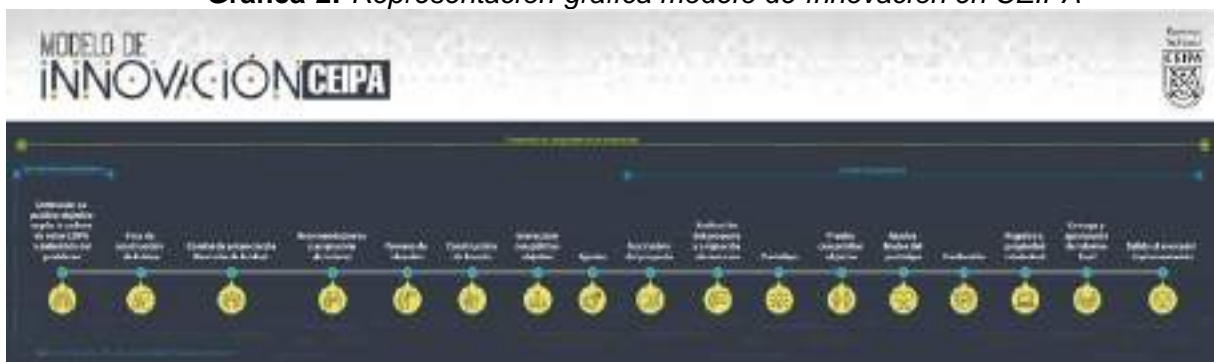
Gráfica 2: Representación gráfica modelo de innovación en CEIPA

Como herramienta metodológica se proporciona el modelo de innovación CEIPA, cuyo procedimiento se puede consultar en el documento denominado “Modelo de Innovación CEIPA 2017”.