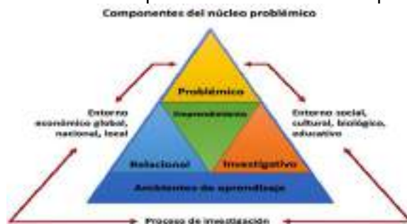
Gráfica 4: Componentes de los núcleos problémicos en CEIPA

que le da identidad al Modelo Pedagógico, es la mediadora de la relación estudiante-docente-conocimiento. Esta mediación es reflexionada, aplicada y desarrollada dentro del núcleo, para la interacción de todos los componentes en el campo virtual con las herramientas que les proporcionan las TICS.