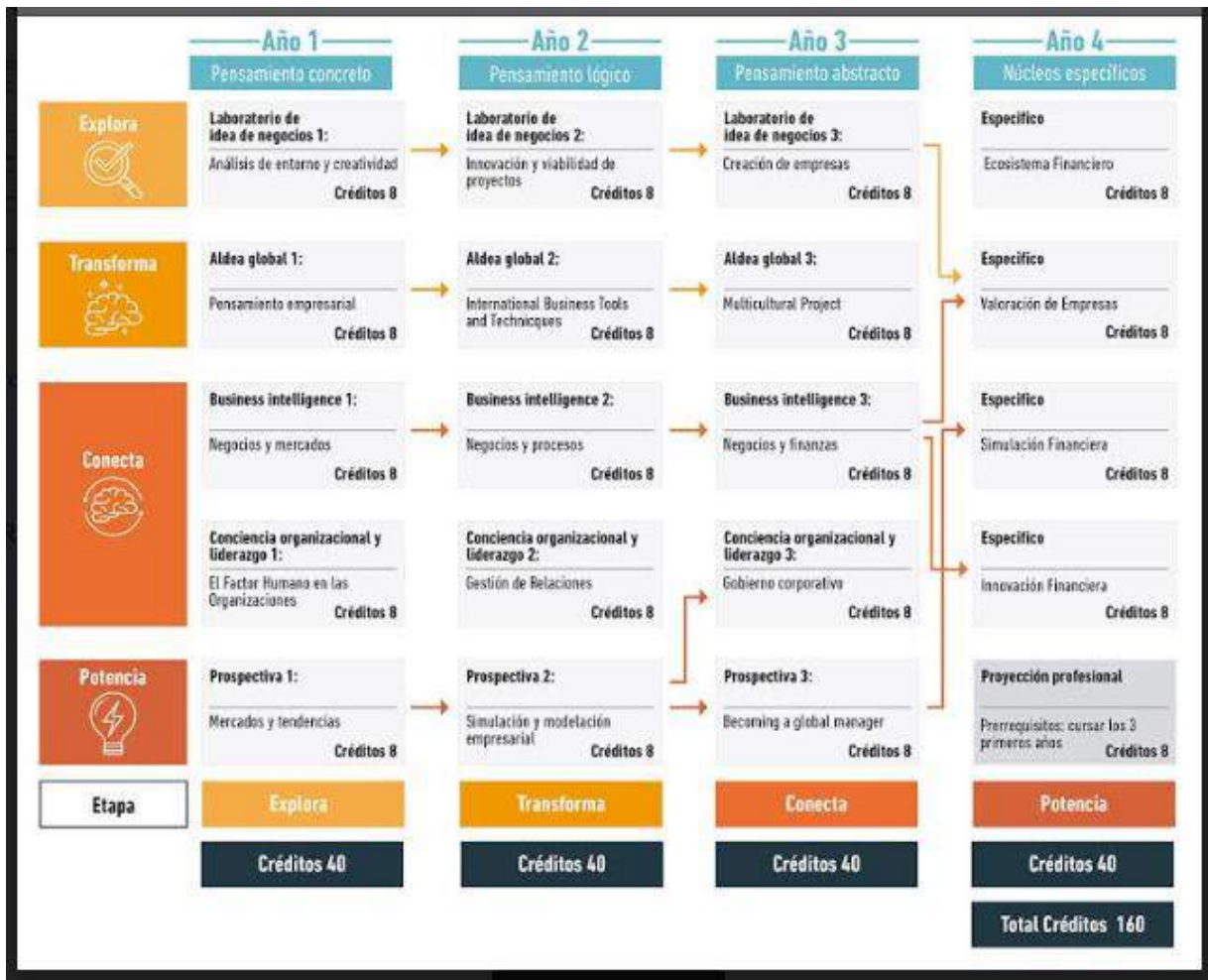
Ilustración 3 - Nuevo Plan de Estudios del Programa Administración Financiera de CEIPA.