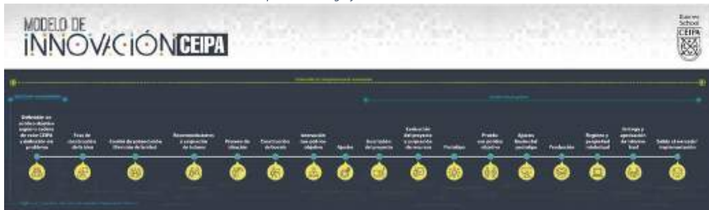
Ilustración 2 - Representación gráfica modelo de innovación en CEIPA

Como herramienta metodológica se proporciona el modelo de innovación CEIPA, cuyo procedimiento se puede consultar en el documento denominado “Modelo de Innovación CEIPA 2017”.