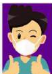
Uso adecuado del Tapabocas.