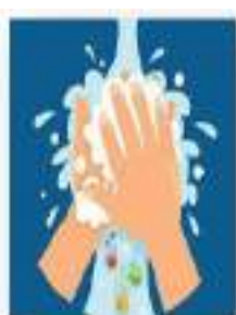
Lavado de manos con agua y jabón.

Las medidas de bioseguridad que han mostrado mayor evidencia de contención de la transmisión del virus son: