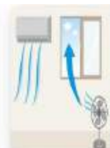
Ventilación natural o con equipos que no realicen recirculación de aire.