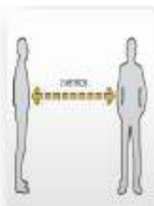
Distanciamiento físico de 2 metros.